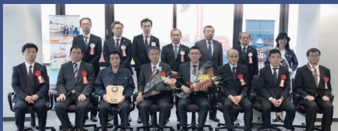
新潟港入港セレモニーの様子

2024年問題対策としてJR輸送、長距離陸上輸送の代替輸送を実現いたします。低炭素輸送の推進、モーダルシフト輸送にも貢献してまいります。