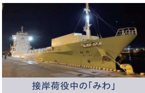
接岸荷役中の「みわ」